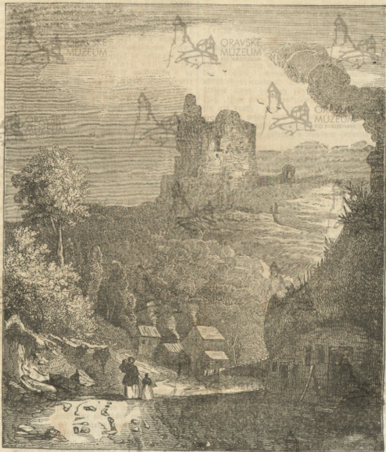
(Hrad Anarresborough w Angličanedj.)